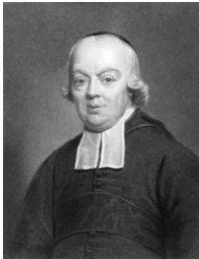
Charles-Michel de l'Épée

Bonjour tout le monde, je vais vous raconter le travail de Charles-Michel de l'Épée auprès des enfants sourds. C'est un prêtre qui a vécu au XVIII e siècle. Il devient le précepteur* de deux sœurs jumelles sourdes. Pour leur apprendre la grammaire et le catéchisme, il met au point une nouvelle langue : la langue des signes . Dans cette langue, un signe représente un mot ou une idée. On les appelle les signes méthodiques.